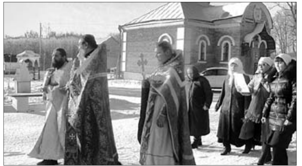
Крестный ход в день юбилейного престольного праздника в Лучегорском приходе