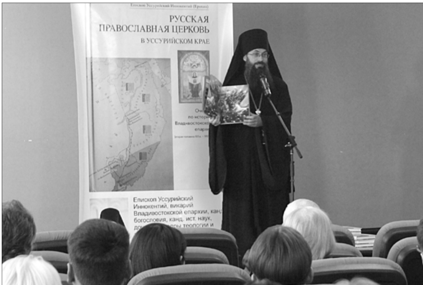
Презентация книги в здании Научной библиотеки ДВФУ

Владивосток. 23 ноября 2012 года епископ Уссурийский Иннокентий, викарий Владивостокской епархии, представил широкой общественности свой новый труд «Русская Православная Церковь в Уссурийском крае. Очерки по истории Владивостокской епархии (вторая половина XIX в. — 1917 г.)».