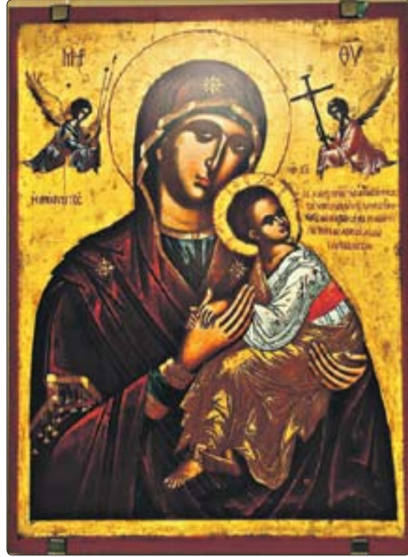
Икона Божией Матери «Страстная»

Идея — собрать в одной экспозиции старинные Богородичные образы и представить уникальную коллекцию в крупных российских