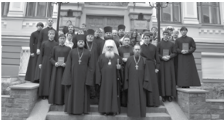
Преподавательский состав и выпускники Духовного училища

В этом году Владивостокскому Духовному училищу