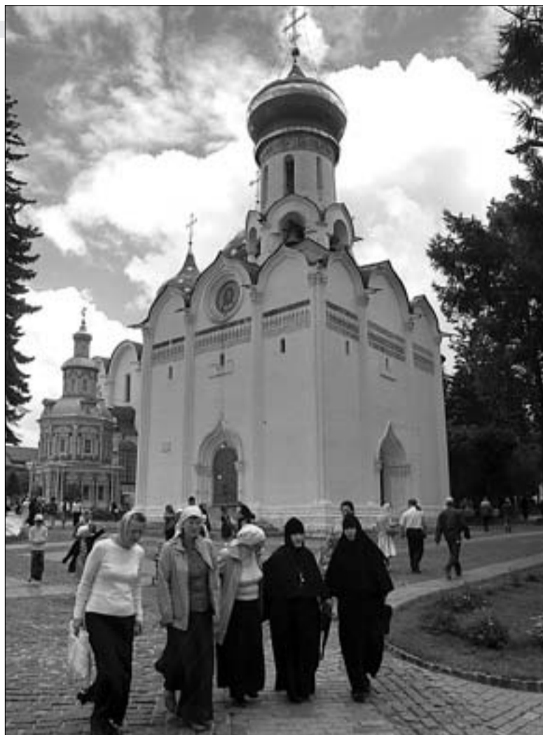
Приморские паломники в Троице-Сергиевой Лавре г. Сергиев Посад.

— Самым большим впечатлением было оказаться в центре государства Российского и сослужить Святейшему Па-