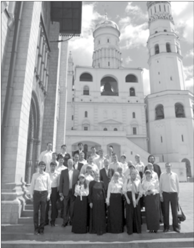
Архиерейский хор Приморской Митрополии на ступенях Успенского собора Кремля рядом с колокольней Ивана Великого

За богослужением пел Архиерейский хор митрополии. Затем состоялась экскурсия по Троице-Сергиевой лавре. После чего делегаты отправились в художественно-производственное предприятие Русской Православной Церкви Софрино.