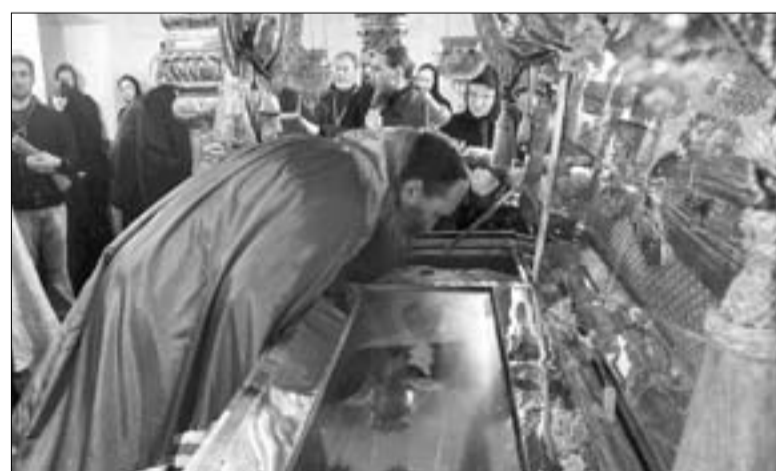
Епископ Арсеньевский и Дальнегорский Гурий у раки с мощами блаженной Матроны Московской