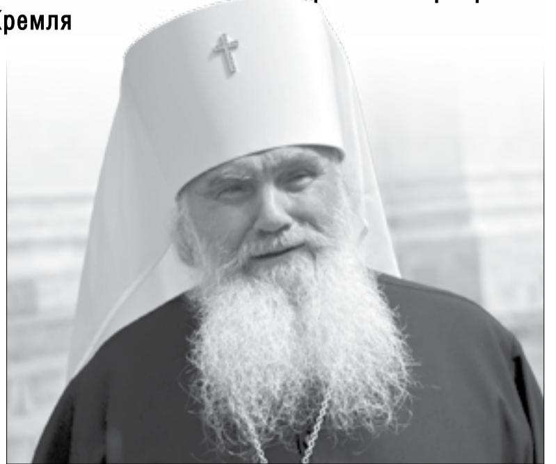
Митрополит Владивостокский и Приморский Вениамин

«Сегодня, в день памяти святителя Ионы, митрополита Московского, по Вашему благословению вместе с Вами в древнем Успенском соборе Кремля молилась вся Приморская митрополия, — сказал, в частности, митрополит Вениамин.