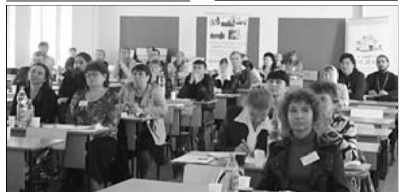
Фотозарисовки рабочих моментов заседаний форума

В числе участников — порядка 70-ти человек, — представители Приморской и Приамурской митрополии, сфер здравоохранения, наркоконтроля, государственных и общественных организаций, а также делегаты Международного крестного хода «От океана до океана», прибывшие во Владивосток со списком Ченстоховской иконы Божией Матери.