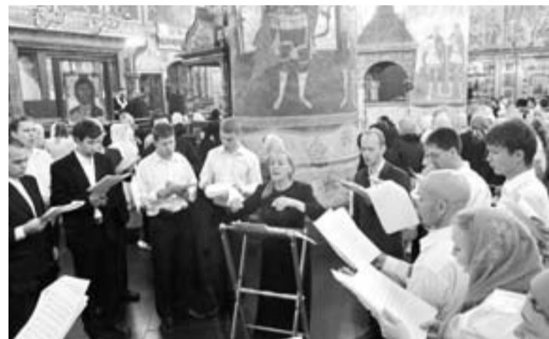
Хор Приморской Митрополии за богослужением в Успенском соборе Кремля