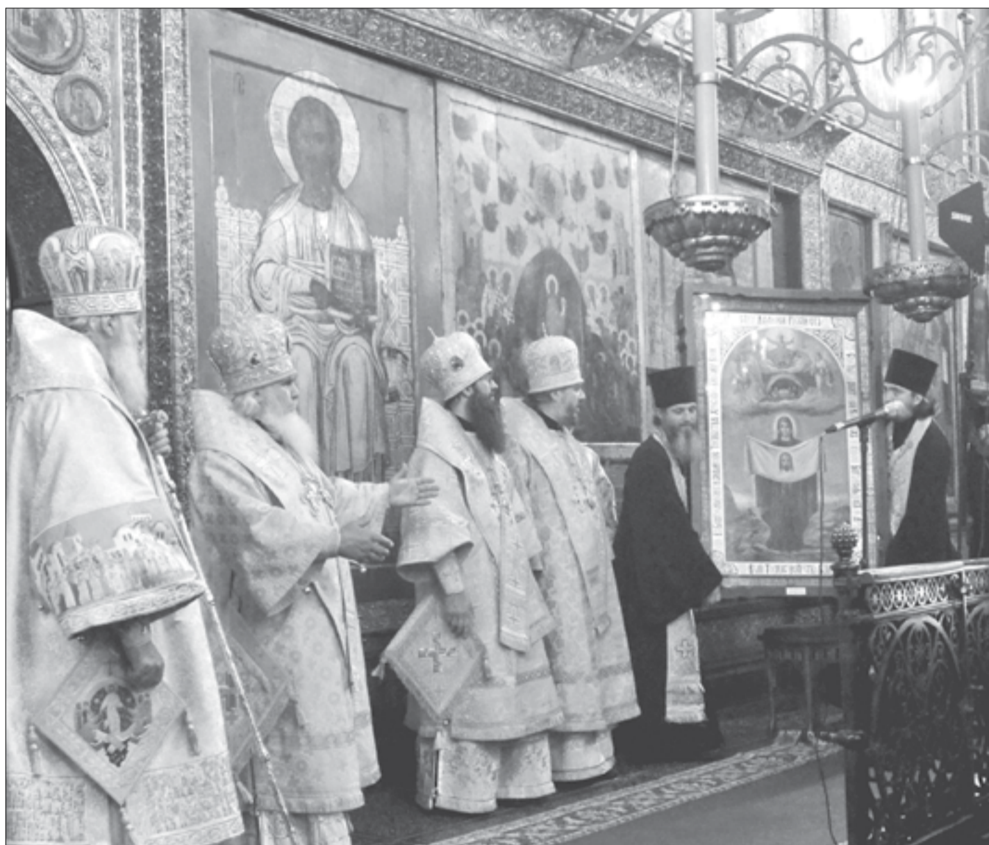
Москва. Успенский собор Кремля. Митрополит Владивостокский и Приморский Вениамин преподносит в дар Святейшему Патриарху Московскому и всея Руси Кириллу Порт-Артурскую икону Божией Матери

С 27 по 29 июня в Москве с официальным визитом находилась многочисленная делегация Приморской митрополии. Ее возглавил митрополит Владивостокский и Приморский Вениамин.