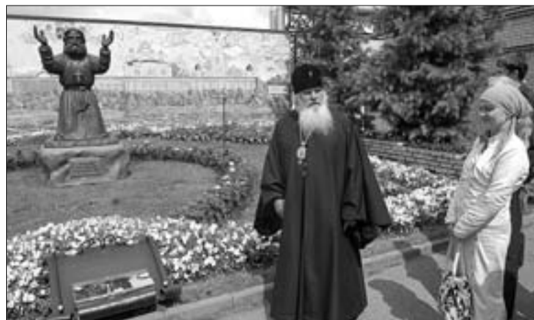
Во дворе художественно-производственного предприятия «Софрино»

русского народа и старинного Успенского собора прошла здесь перед нами за один день». Историчностью этого места прониклись все, кто присутствовал в храме. За богослужением и время ощущалось по-особому. Также чувствовалась молитва всех людей, собравшихся вместе. Сама служба прошла довольно быстро, и особой напряженности я не ощутил. Хотя все мы, конечно, долго готовились, переживали, но всё прошло очень спокойно. Я задумался: почему воцарилось такое спокойствие вокруг? Накануне мы побывали у блаженной Матроны Московской, совершили там молебен с акафистом, и тут я понял, что после этого паломничества всем нам и стало так спокойно. Это ощущение спокойствия сохранялось затем все дни нашего пребывания в Москве.