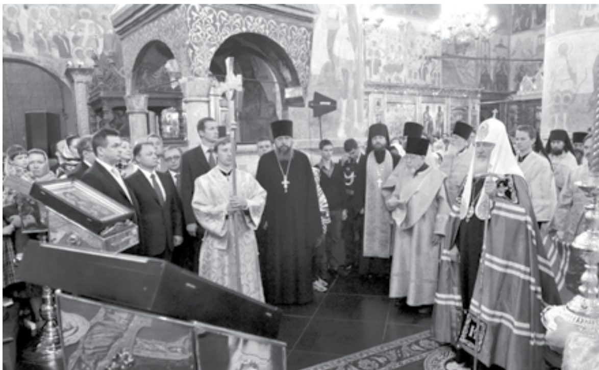
Встреча Святейшего Патриарха Кирилла в Успенском соборе Кремля