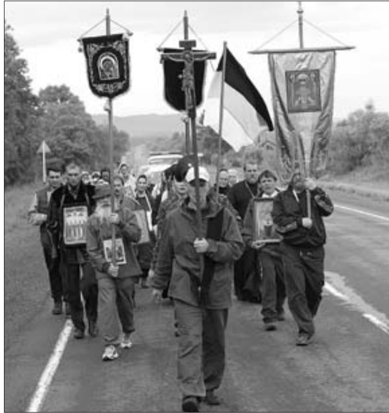
Паломники - участники крестного хода по дорогам Приморья