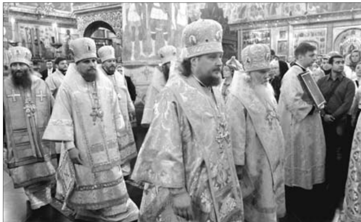
Епископат на богослужении в Успенском соборе Московского Кремля