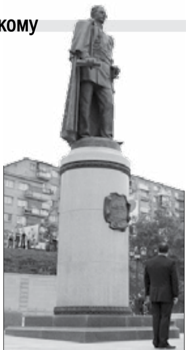
Памятник Н.Н. Муравьеву-Амурскому во Владивостоке