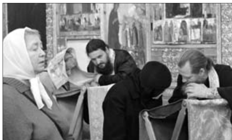
Духовенство Митрополии на исповеди в Успенском соборе Кремля