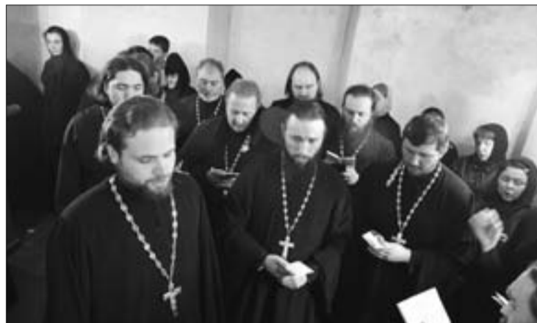
Духовенство Митрополии поет акафист блаженной Матроне Московской в Покровском монастыре в Москве