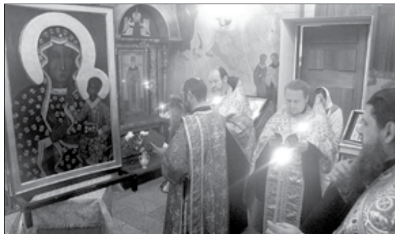
Молебен перед Ченстоховской иконой в храме св. прав. Иоанна Кронштадтского